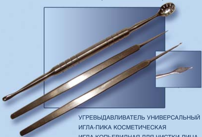
УГРЕВЫДАВЛИВАТЕЛЬ УНИВЕРСАЛЬНЫЙ ИГЛА-ПИКА КОСМЕТИЧЕСКАЯ ИГЛА КОПЬЕВИДНАЯ ДЛЯ ЧИСТКИ ЛИЦА