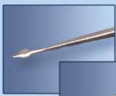
ИГЛА КОПЬЕВИДНАЯ ДЛЯ ЧИСТКИ ЛИЦА №2