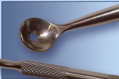
УГРЕВЫДАВЛИВАТЕЛЬ С ЛОЖКОЙ 8мм И ПЕТЛЕЙ