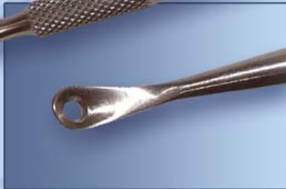
УГРЕВЫДАВЛИВАТЕЛЬ С ЛОЖКОЙ 3.5мм И ПЕТЛЕЙ