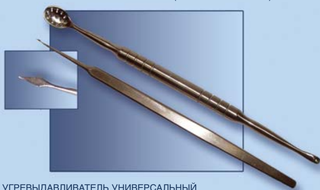
УГРЕВЫДАВЛИВАТЕЛЬ УНИВЕРСАЛЬНЫЙ ИГЛА КОПЬЕВИДНАЯ ДЛЯ ЧИСТКИ ЛИЦА